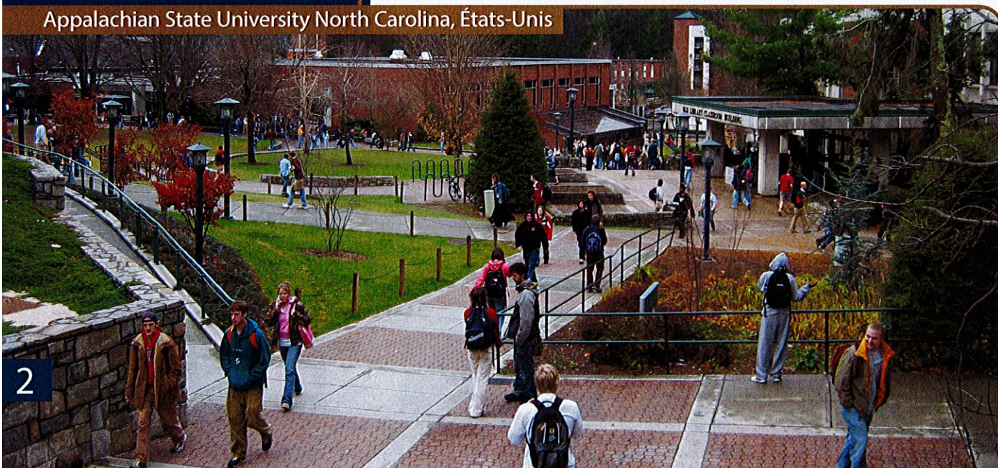
Appalachian State University North Carolina, États-Unis

1 Sauf exception particulière selon le diplôme et/ou la destination.