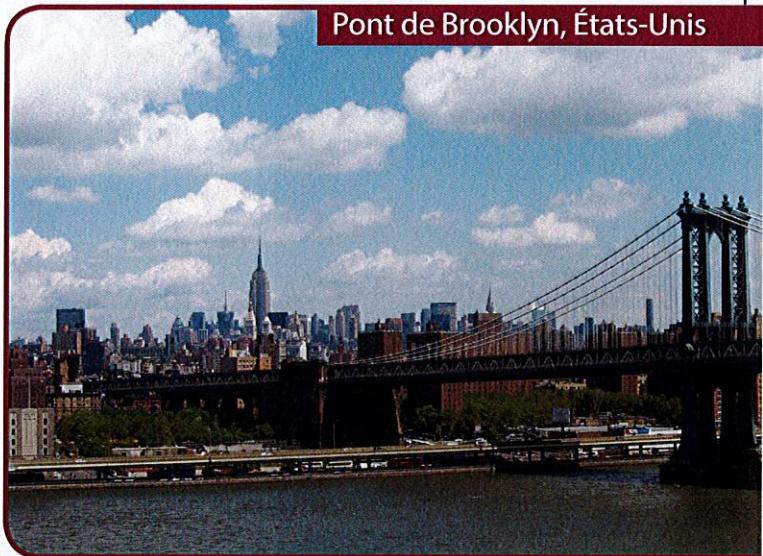
Pont de Brooklyn, États-Unis

3 Se renseigner plus particulièrement pour les destinations hors-Europe.