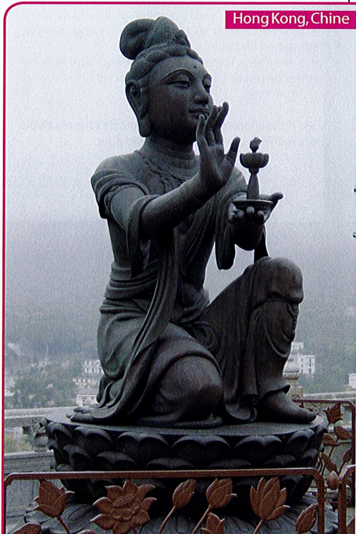
Hong Kong, Chine

Ils sont là pour vous informer, vous conseiller et vous aider dans vos démarches afin de préparer au mieux votre projet de mobilité.